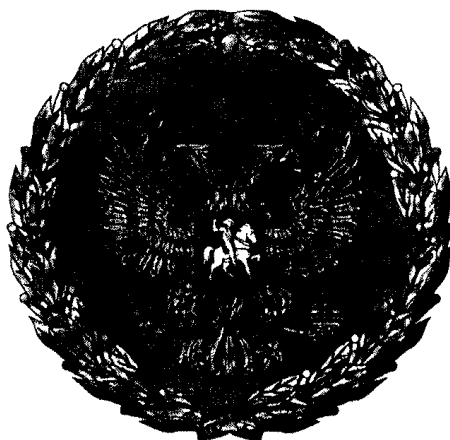
РИСУНОК НАГРУДНОГО ЗНАКА К ПОЧЕТНОЙ ГРАМОТЕ ПРЕЗИДЕНТА РОССИЙСКОЙ ФЕДЕРАЦИИ